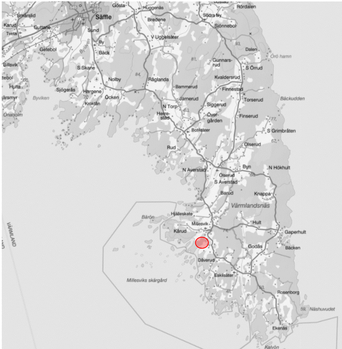
Figur 1. Kartan visar planområdes ungefärliga placering i rött.