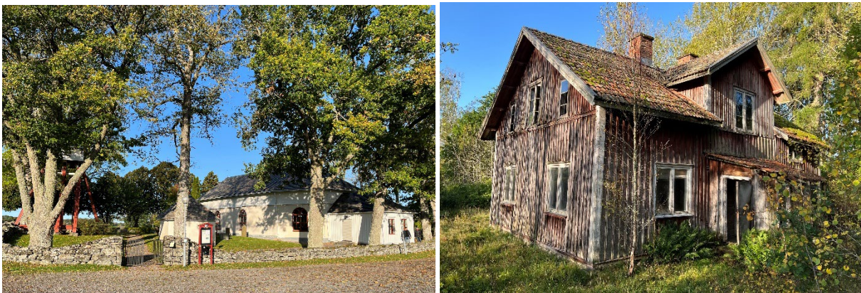
Figur 6. Bilder över kyrkan och del av gårdstomt.