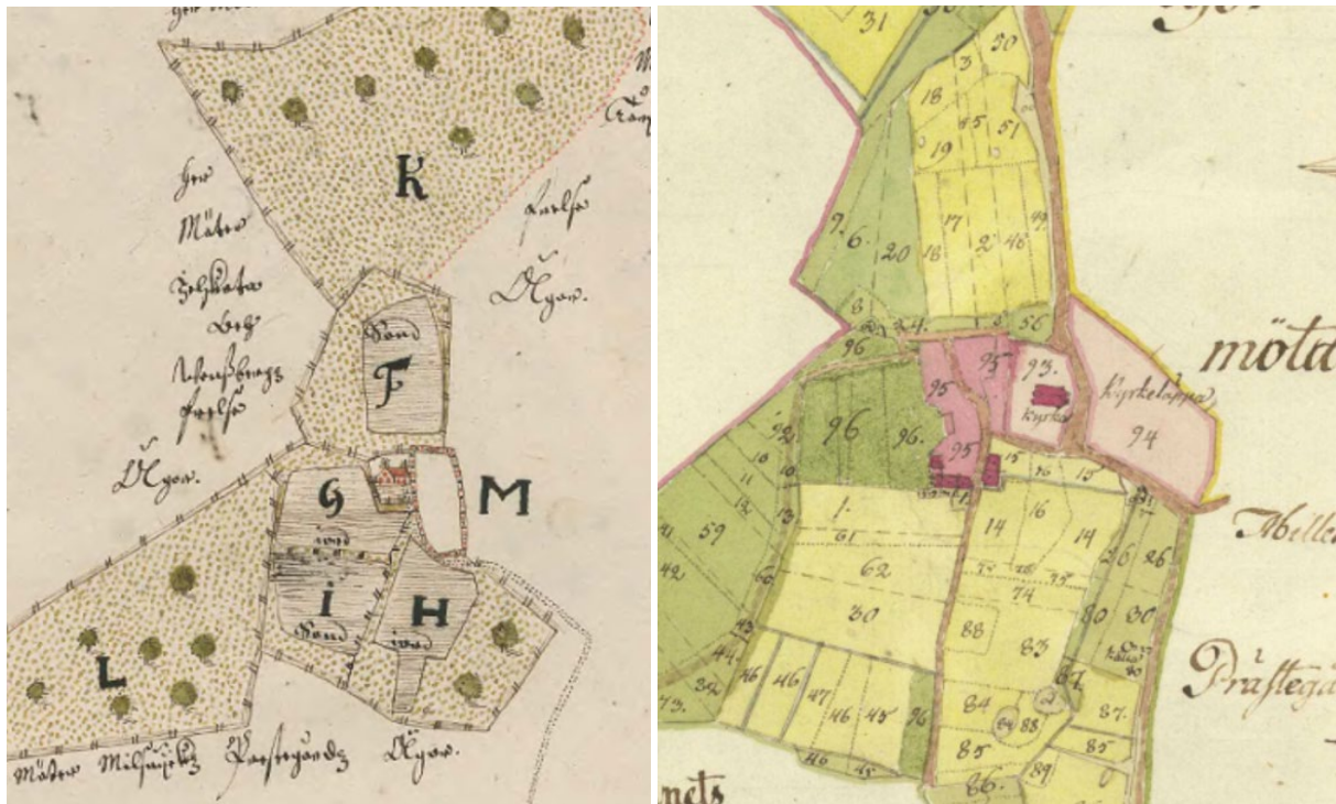
Figur 9. Karta från 1647 till vänster och från 1794 till höger över området och landskapets bebyggelsehistoriska utveckling.