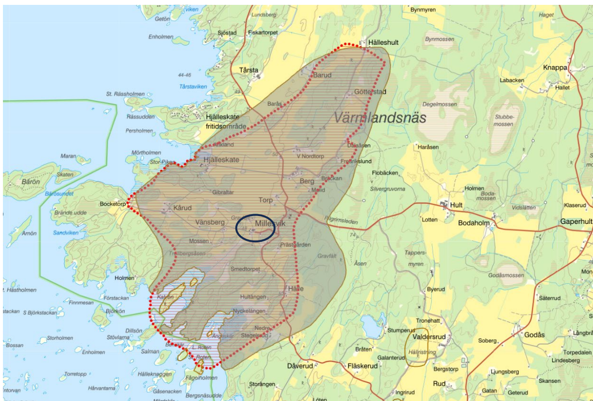
Figur 3. Kartan visar riksintresseavgränsningen för Millesvik enligt 3 kap 6 § MB med den rödstreckade linjen, samt områdesavgränsningen för Millesvik i kulturmiljöprogrammet Ditt Värmland med grått markerat område, i förhållande till föreslaget område för områdesbestämmelser markerat med svart.

Framtagandet av områdesbestämmelser går i linje med förslag till åtgärder i kulturmiljöprogrammet.