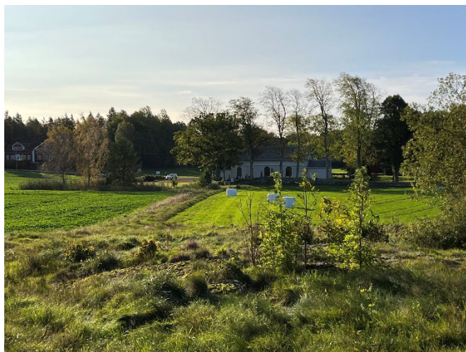
Figur 7. Bilder över Millesviks kyrka och klockstapel samt kringliggande jordbruksmark.