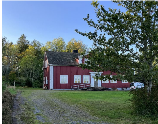
Figur 8. Skolbyggnaden.

Bebyggelsen inom områdesbestämmelsen består av ett äldre skolhus i 1,5 plan med stående röd träpanel. Utöver skolbyggnaden och kyrkan så finns det även tre gårdstomter som även omfattas av den möjliga fornlämningen, L2006:4230, som är bestående av 3 gårdslägen. Gårdarna är i varierande standard men är alla uppföra i 1–1,5 plan. Bebyggelsen både inom områdesbestämmelserna och närmast kringliggande bebyggelse utgörs i huvudsak av bebyggelse av agrar karaktär.