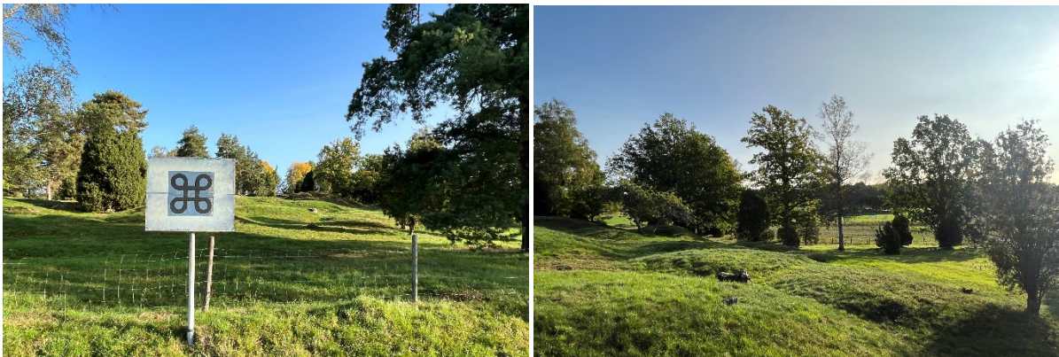
Figur 5. Bilder över fornlämning avseende gravfält.